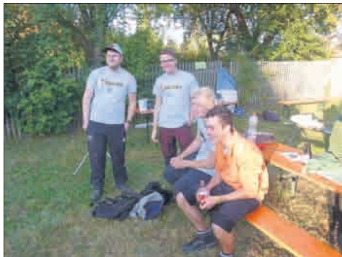
Jakobs Dröhnung light