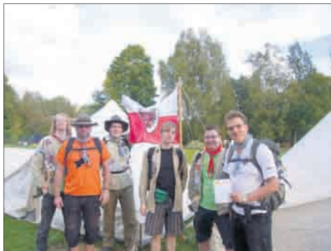
Team Jakobs Dröhnung am Start